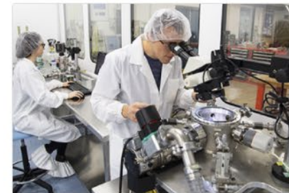
Sezione Scuole di Specializzazione