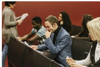
Sezione Esami di Stato