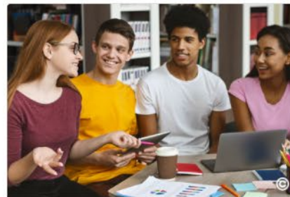
Sezione Post Laurea e Formazione Insegnanti Scuola Secondaria